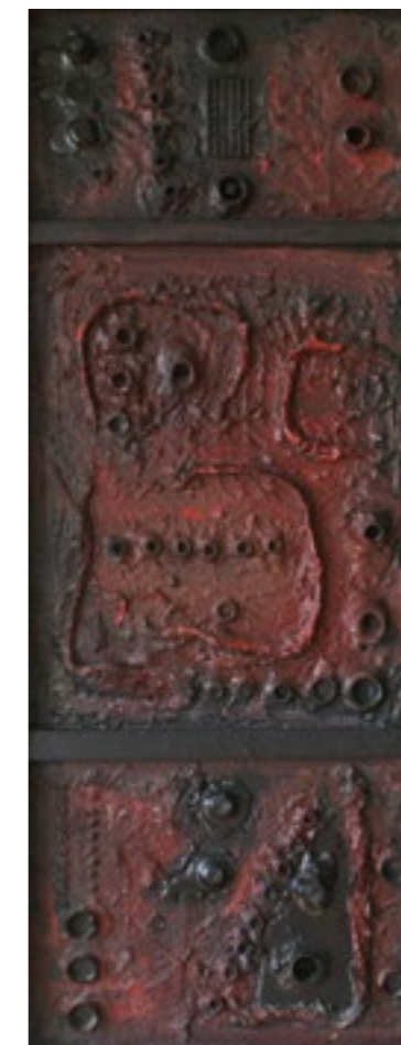
Bragi Ásgeirsson. Án titils , 1968 Fundnir hlutir og málning á tré, 139 x 62 cm

Upphaflega hékk myndin við stigann í anddyrinu – þar sem verkið Svo margt er núna – en Gunnar Örn var aldrei sáttur við hana þar; fannst hún ekki njóta sín sem skyldi. Með tilkomu nýju álmunnar fann hann myndinni betri stað og hjálpaði sjálfur til við flutninginn á henni. Þess má einnig geta að Gunnar Örn réði staðsetningu allra hinna verkanna sem tengjast honum og sá jafnframt um uppsetningu þeirra.