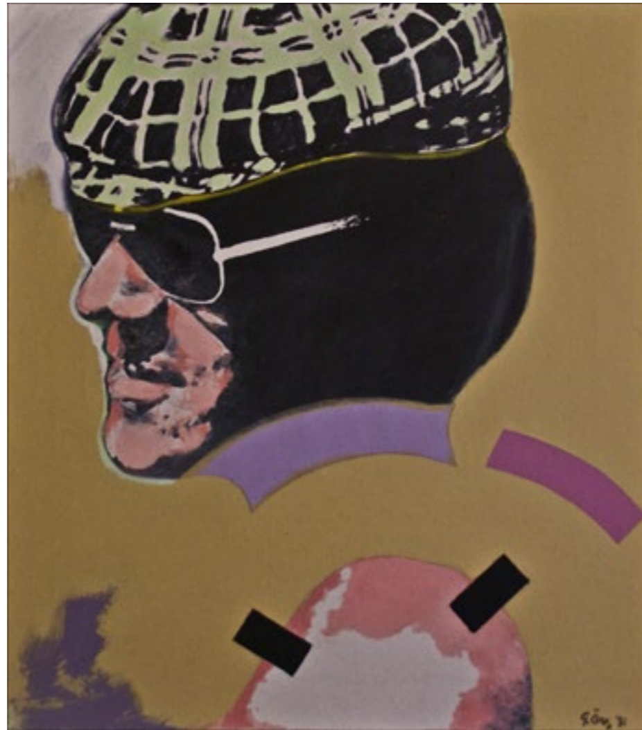
Gunnar Örn Án titils, 1981 Olía á striga, 51 x 45 cm

líðandi stundar sem hann tjáði á kíminn og gamansaman hátt. Margar myndir eru til eftir hann af þekktum Íslendingum sem lýsa vel færni hans sem portrettmálari og teiknari. Hann var líka afkastamikill greinahöfundur og skrifaði, myndskreytti og gaf út fimm bækur þar sem lífsskoðanir hans og mannlýsingar nutu sín vel.